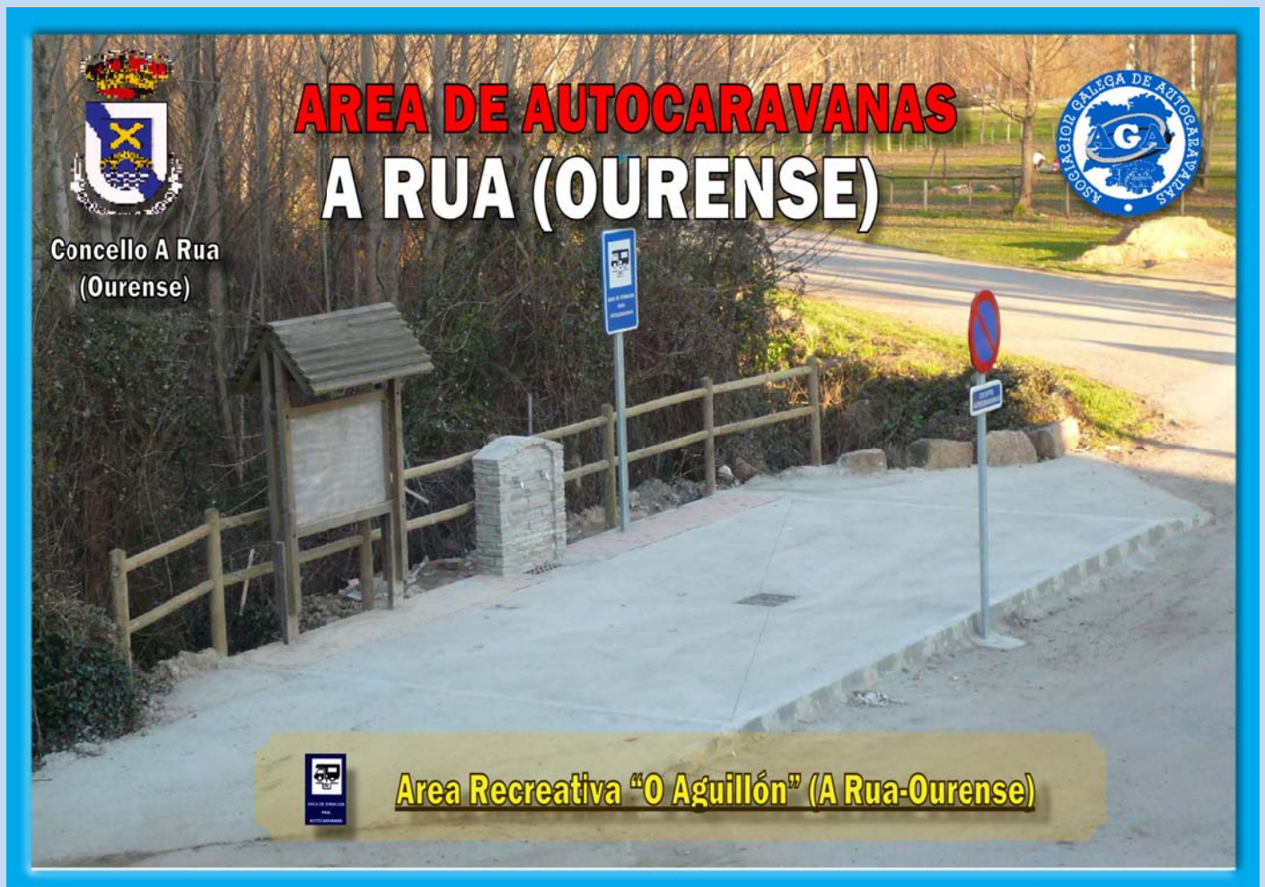
Área de autocaravanas en O Aguillón