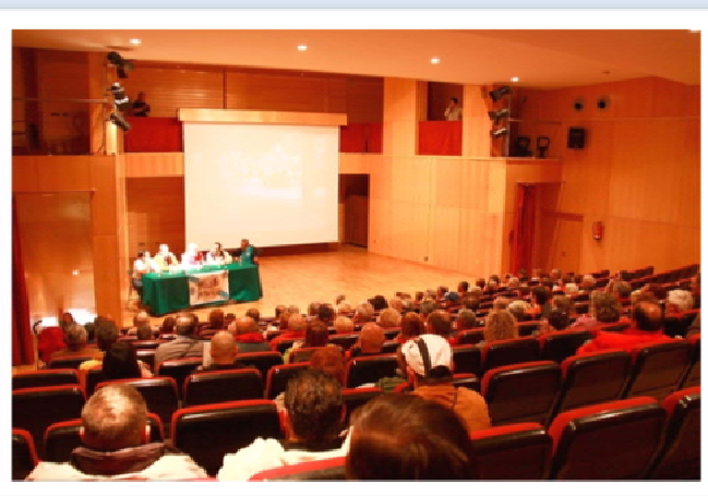
Acto inaugural en el Auditorio de Redondela

Durante los días 27, 28 y 29 se procedió a inaugurar el área de autocaravana en Redondela cuyos los actos de inauguración que empezaron por la mañana del sábado, con la asistencia al Auditorio de Redondela, donde pudimos apreciar de un modo directo a través de los responsables municipales de turismo y cultura, toda la riqueza cultural, turística y etnográfica. Una vez finalizado este acto nos desplazamos hasta el área de autocaravanas para observar un situ las instalaciones. Por cortesía del Concello de Redondela fuimos agasajados con un magnifico aperitivo con delicias de todo tipo así como la especialidad de Redondela que no es otro que los chocos.