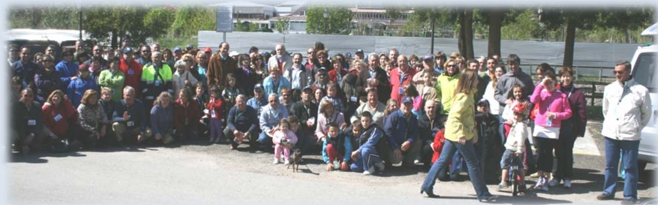
Foto de grupo de los asistentes

Por la tarde, el acto principal de la jornada fue la visita a la Isla de San Simón donde un catamarán nos desplazó desde el muelle de Cesantes hasta allí, a pesar de ser una pequeña isla, 35.000 m 2 , tiene gran notoriedad en la historia de Galicia y especial de Pontevedra.