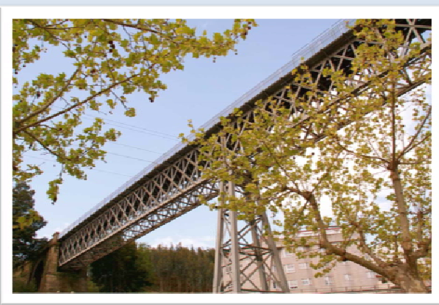
Aperitivo gentileza del Concello y vista del Viaducto Eiffel en Redondela

La isla fue un antiguo centro monástico saqueado por piratas ingleses y cantado por el poeta Mendinho en la Edad Media. Posteriormente la isla se convirtió en una leprosería, y una prisión sucesivamente. Durante la guerra y posguerra franquista la isla fue usada como campo de concentración