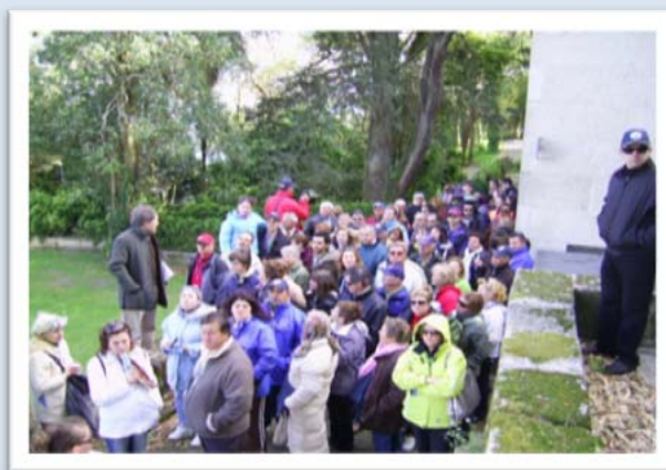
Asistentes durante la travesía y explicación con guía.