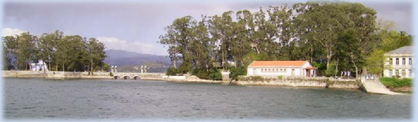
Panorámica de la Isla de San Simón